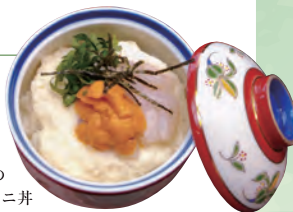
鮮度抜群の 鳥賊と生ウニ丼