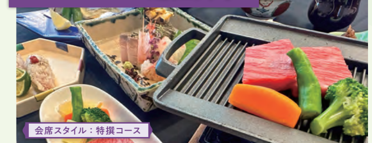
会席スタイル：特撰コース