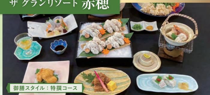
御膳スタイル：特撰コース