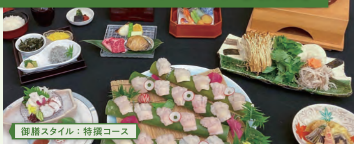
御膳スタイル：特撰コース