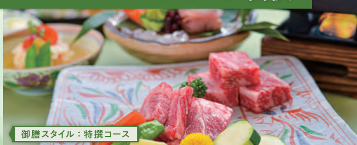
御膳スタイル：特撰コース