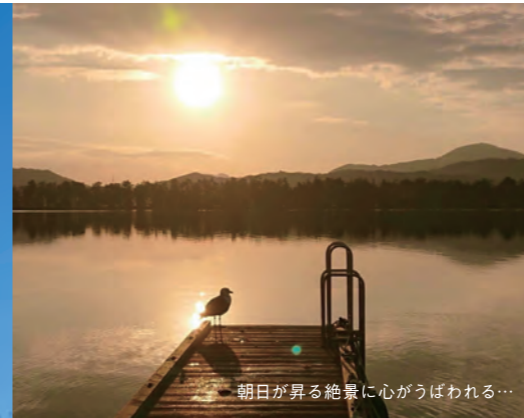
朝日が昇る絶景に心がうばわれる…