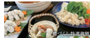
鱧づくし特撰御膳