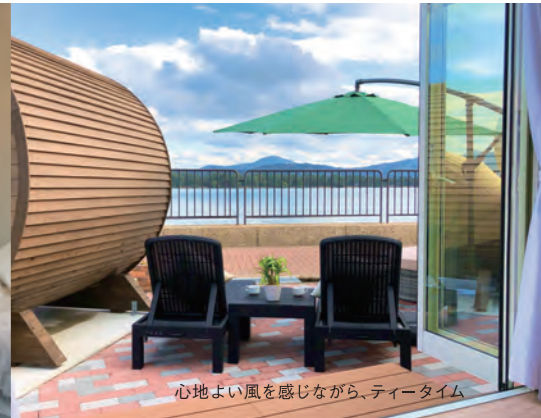
心地よい風を感じながら、ティータイム

日本三景のひとつ「天の橋立」の雄大な景色をひとりじめできる 絶好のロケーションでグランピングをお楽しみください。