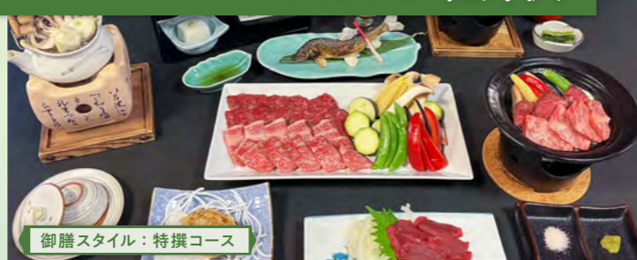
御膳スタイル：特撰コース