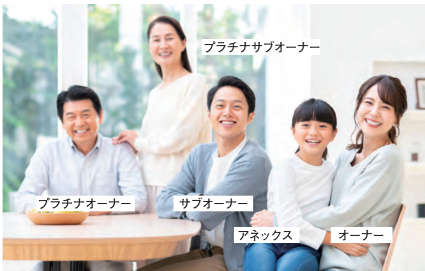
プラチナサブオーナー