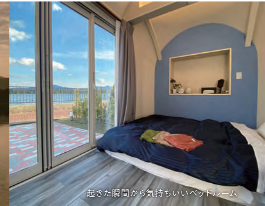
起きた瞬間から気持ちいいベッドルーム