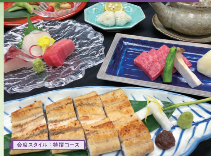
会席スタイル：特撰コース