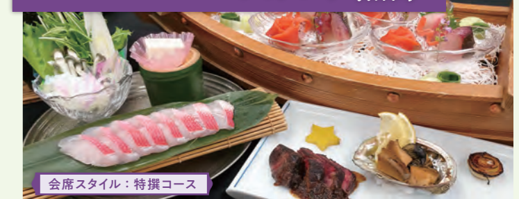
会席スタイル：特撰コース