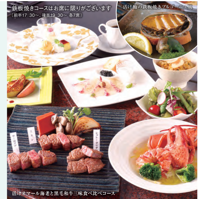
鉄板焼きコースはお席に限りがございます (前半17:30~、後半19:30~ 各7席)

A 黒毛和牛ミスジ C 近江大倉和牛ハンバーグ B 黒毛和牛サーロイン D 黒毛和牛フィレ +1,650円(税込)