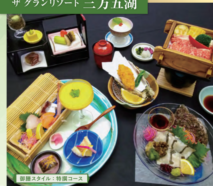
御膳スタイル：特撰コース