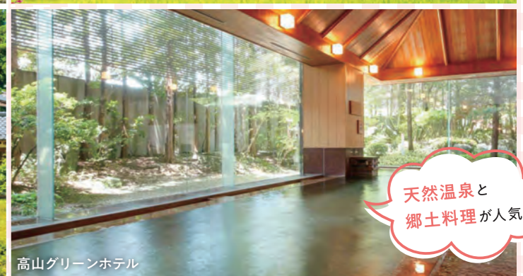
高山グリーンホテル