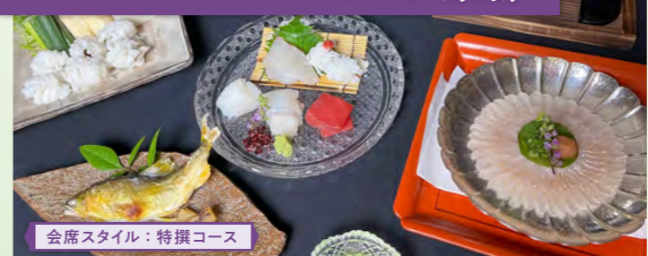
会席スタイル：特撰コース