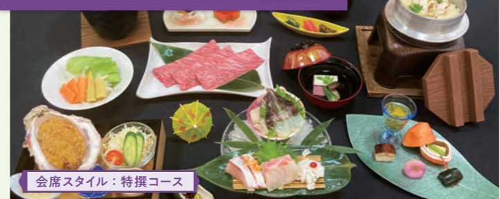
会席スタイル：特撰コース