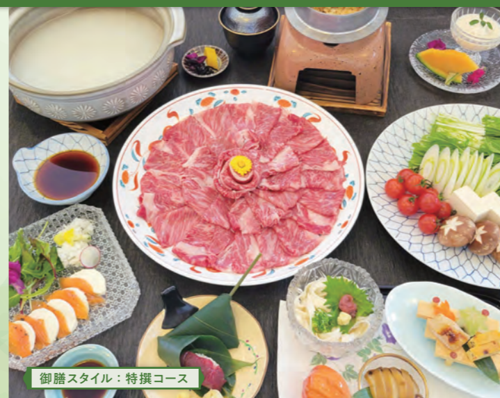
御膳スタイル：特撰コース