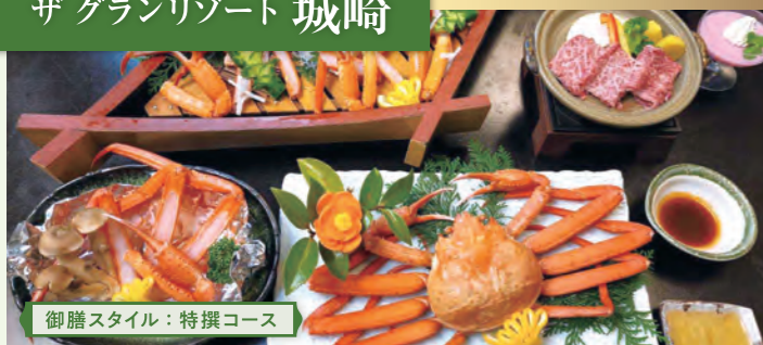
御膳スタイル：特撰コース