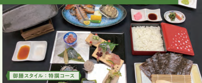
御膳スタイル：特撰コース