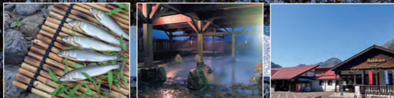
岐阜県関市 板取川温泉

山々に囲まれて大自然に抱かれる露天風呂。 秘湯の情緒たっぷりの湯けむり。 美肌の湯で楽しむ贅沢な露天ジャグジー。 「板取川温泉バーデェハウス」で 森林浴と温泉浴を満喫しよう！