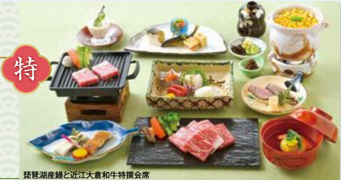
琵琶湖産鰻と近江大倉和牛特撰会席

和 琵琶湖の 夏の恵みと 蔵尾ホーク しゃぶしゃぶ 和み会席 料 近江大倉和牛 二種食べ比べ 鉄板おすすめ会席 特 琵琶湖産鰻と 近江大倉和牛 特撰会席