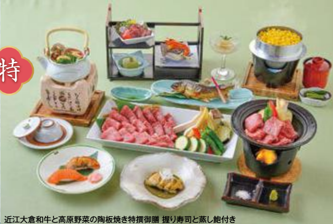
近江大倉和牛と高原野菜の陶板焼き特撰御膳 握り寿司と蒸し鮑付き