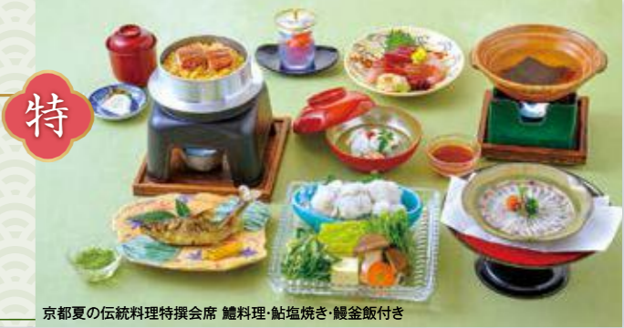
京都夏の伝統料理特撰会席 鰻料理・鮎塩焼き・鮎釜飯付き

和 鱧の蓼味噌焼きと 近江大倉和牛 すき焼き 和み会席 料 夏の京料理と 近江大倉和牛 おすすめ会席 特 京都夏の伝統料理 特撰会席 鰻料理・ 鮎塩焼き・ 鮎釜飯付き