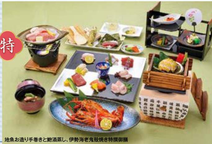
地魚お造り手巻きと鮑酒蒸し、伊勢海老鬼殻焼き特撰御膳