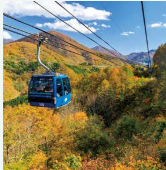
苗場ドラゴンドラ