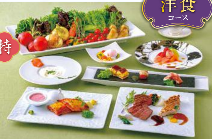
近江大倉和牛コース・静岡ハーブチキン・梅風味の鰻パートフィロ包み特撰コース

近江大倉和牛コース・ 静岡ハーブチキン・ 梅風味の鰻 パートフィロ包み 特撰コース