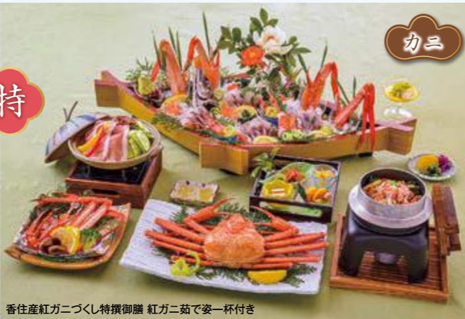
香住産紅ガニづくし特撰御膳 紅ガニ茹で姿一杯付き