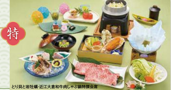
とり貝と岩牡蠣・近江大倉和牛肉しゃぶ鍋特撰会席

和 海鮮もずく鍋 和み会席 料 とり貝と 蓮根釜飯 おすすめ会席 特 とり貝と岩牡蠣・ 近江大倉和牛肉 しゃぶ鍋 特撰会席