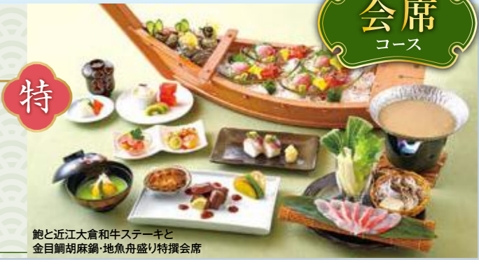
鮑と近江大倉和牛ステーキと 金目鯛胡麻鍋・地魚舟盛り特撰会席

和 鮑と近江大倉和牛ステーキと ふじの国ホーク 胡麻鍋・ 地魚舟盛り 和み会席 料 鮑のソテーと 近江大倉和牛 胡麻鍋・ 地魚舟盛り おすすめ会席 特 鮑と近江大倉和牛ステーキと 金目鯛胡麻鍋・ 地魚舟盛り 特撰会席