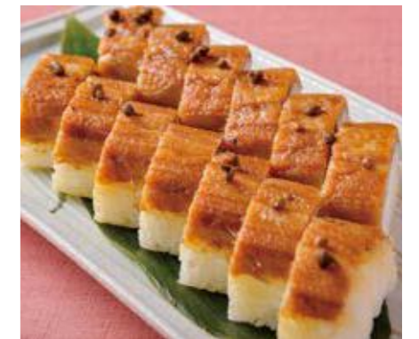
GR 天の橋立 近大産マアナゴ丸ごと棒寿司