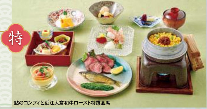
鮎のコンフィと近江大倉和牛ロースト特撰会席

和 合鴨ロース陶板焼と 旬を楽しむ 和み会席 料 近江大倉和牛 サーロイン陶板焼 おすすめ夏会席 特 鮎のコンフィと 近江大倉和牛 ロースト特撰会席