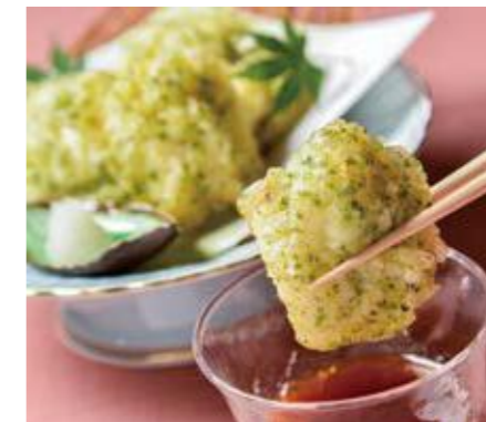
GR 城崎 近大産マアナゴの新わかめ揚げ