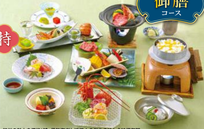
紀州の魅力堪能!鰻、伊勢海老と近江大倉和牛を味わう特撰御膳