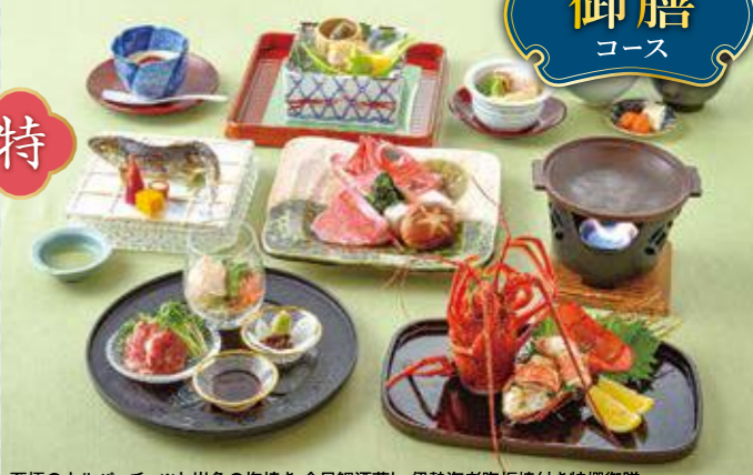
至極のカルパッチョ※と岩魚の塩焼き 金目鯛酒蒸し・伊勢海老陶板焼き特撰御膳