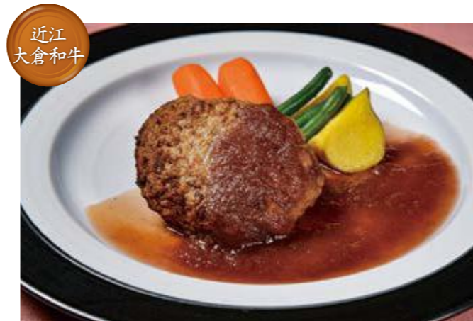
GR 城崎 近江大倉和牛ハンバーグ