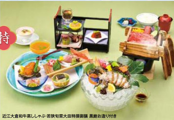
近江大倉和牛蒸ししゃぶ・若狭旬菜大皿特撰御膳 黒鮑お造り付き