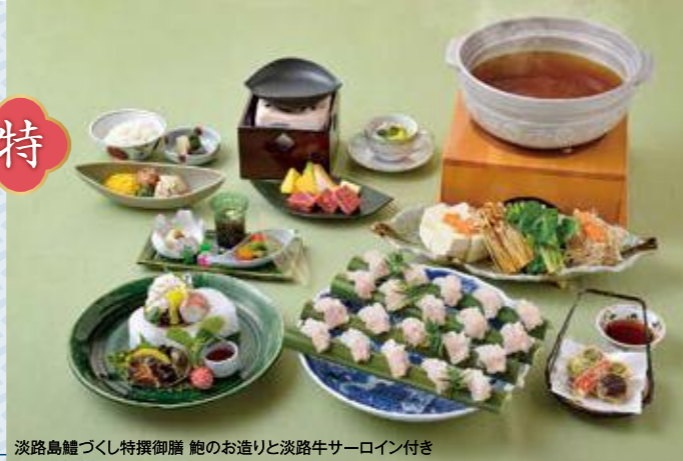
淡路島鱧づくし特撰御膳 鮑のお造りと淡路牛サーロイン付き