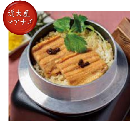
GR 城崎 八鹿産朝倉山椒と 近大産マアナゴ釜飯

全ホテルで、近大産マアナゴ、近江大倉和牛を使った一品料理を提供いたします。各料理長が腕によりをかけた料理をぜひご賞味ください。