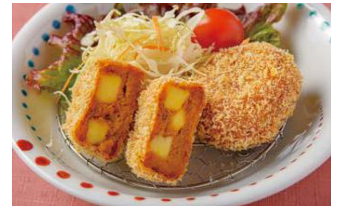
GR 天の橋立 近江大倉和牛のトロトロかぼちゃコロッケ

※献立内容は各ホテルにより異なります。※仕入れの都合によりご提供できない場合があります。予めご了承ください。※料金はお問い合わせください。