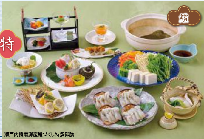
瀬戸内播磨灘産鰻づくし特撰御膳