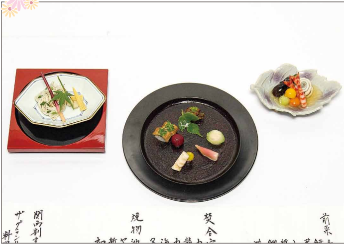
ザ グラン リゾート 有馬 No.042 木原 俊氏