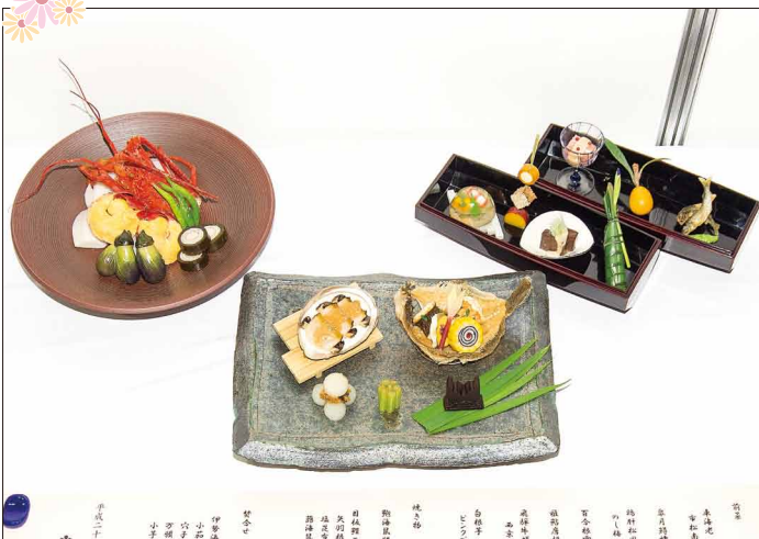
光林坊 No.046 北村 泰裕氏