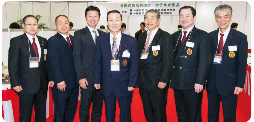
日本料理コンテスト審査員