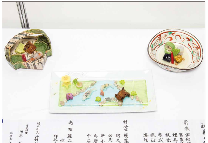
旬彩 旨魯 No.043 森下 明彦氏