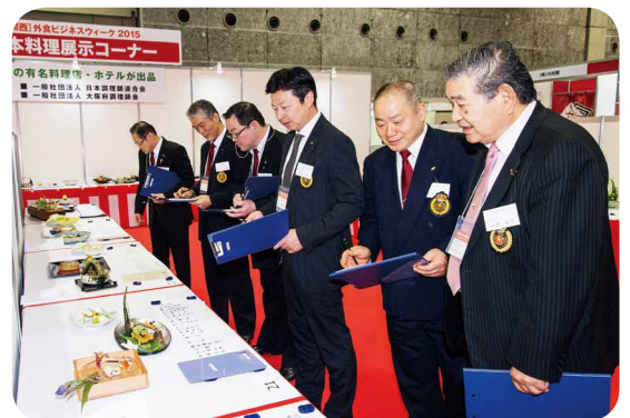
日本料理コンテスト審査の様子