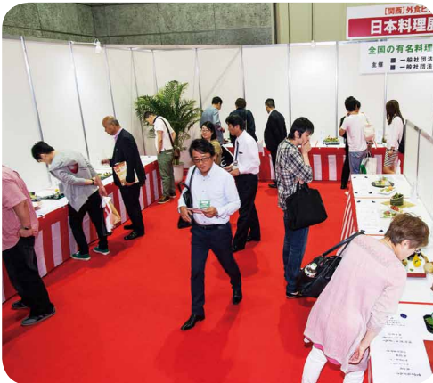
日本料理コンテスト会場の様子