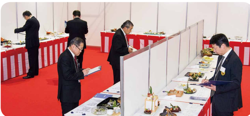
日本料理コンテスト審査の様子