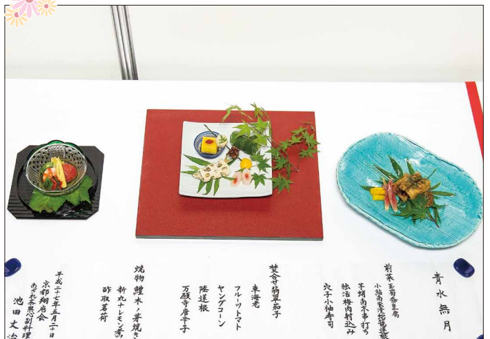
武田尾温泉 紅葉館 別庭 あざれ 茶寮心 No.045 池田 丈治氏