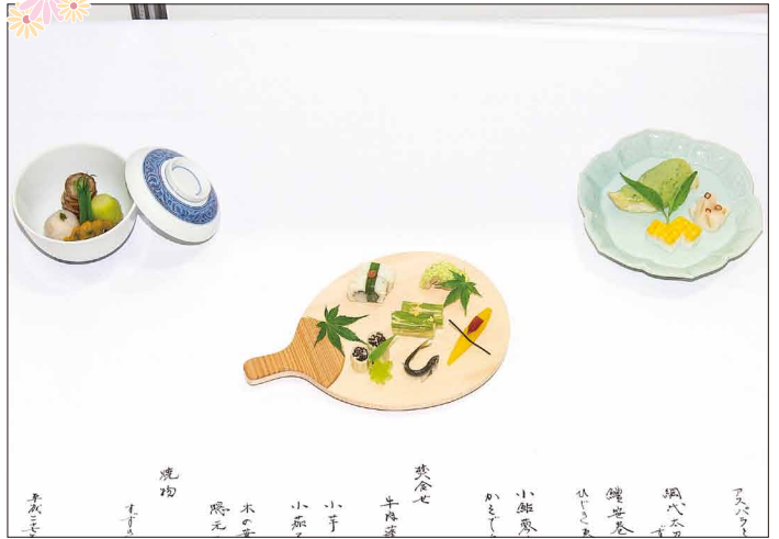
京湯元 ハトヤ瑞鳳閣 No.041 中村 健治氏