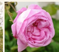
マリー・アントワネットの肖像画にも描かれているオールドローズ ロサ・ケンティフォーリア。エレガントな花姿と香りが魅力。

今年の淡路夢舞台薔薇祭のテーマは「ハプスブルグ家の薔薇」。ヨーロッパに650年君臨し、栄華の歴史を築いたハプスブルグ家の華麗な世界観を200種類のバラで華やかに演出しています。 見どころは、植物館のメイン展示室のダイナミックなローズガーデン。宮廷音楽会が開かれた宮殿室内をイメージした華やかな空間にバラを中心とした春の花木100種類以上が咲き誇ります。ゴールデンウィーク期間中は、音楽イベントやブリザードフラワールンジ、アロマセラピーの体験教室も開催。バラの香りと彩りに心癒やされるひとときをお楽しみください。