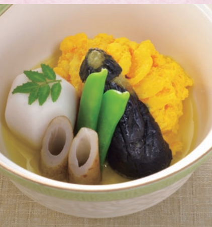
炊き合わせ 鰻黄身煮 玉子の黄身をくぐらせた鰻をふっくら炊き上げました。彩りも美しい一品です。