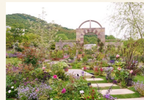
マリー・アントワネットが愛した「アモドゥラレーヌ」の庭を再現。5月7日(火)オープン。