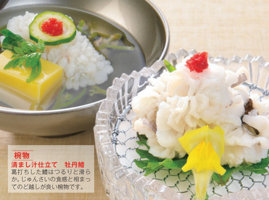
鰻物 清まし汁仕立て 牡丹鰻 葛打ちした鰻はつりと滑らか。じゅんさいの食感と相まってのど越しが良い鰻物です。