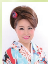
大空 美樹 2005年日本クラウンからデビュー、2015年10周年記念曲「ジブラルタル海峡を越え」「有馬一夜」をリリース。