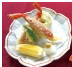
熱海 蟹天麩羅 1,530円(税・サ込)