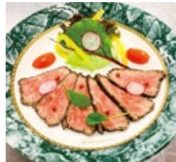
軽井沢 信州牛ローストビーフ 1,815円(税・サ込)