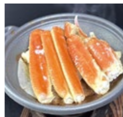
京都 焼きガニ(片身) 3,500円(税・サ込)