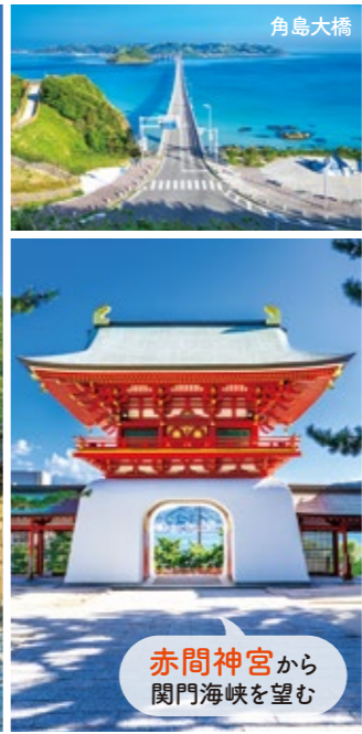
赤間神宮から 関門海峡を望む