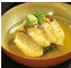
京都 炙り鯛茶漬け 1,500円(税・サ込)