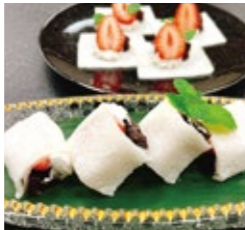
P有馬 苺大福餅 968円(税・サ込)