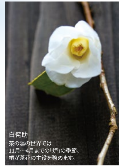
白侘助 茶の湯の世界では11月～4月までの「炉」の季節、椿が茶花の主役を務めます。