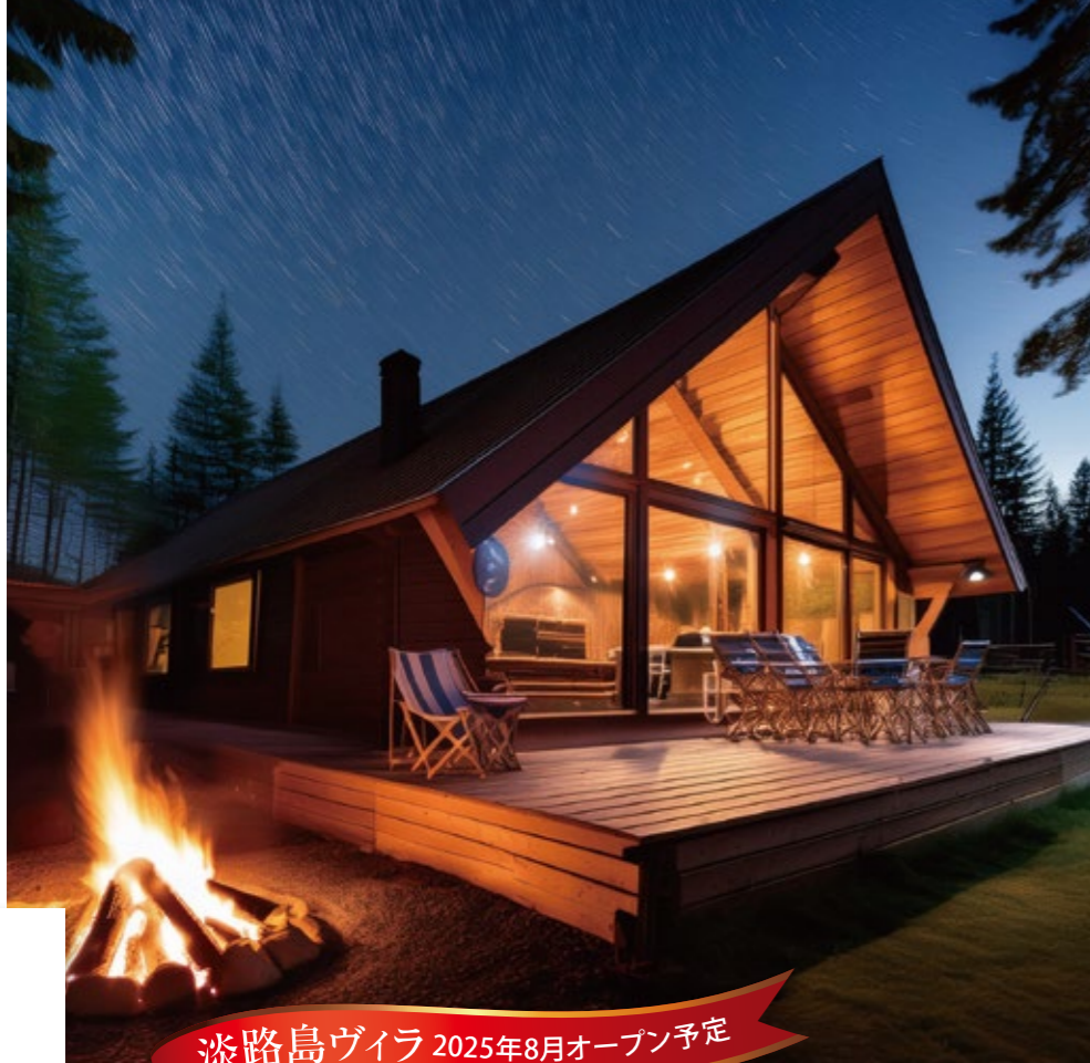
淡路島ヴィラ 2025年8月オープン予定