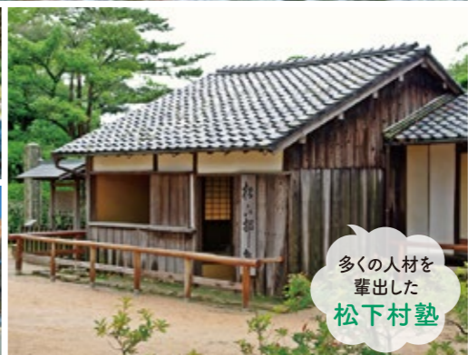
多くの人材を 輩出した 松下村塾