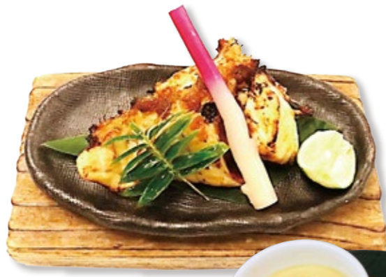
淡路島 3年とらふぐ 焼きふぐ 2,750円(税・サ込)