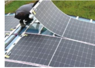
岡山県岡山市 E様邸

湾曲したカーポートは美観を損なわずにソーラーパネルを設置できるだけでなく、設置面積を最大限に活用できるため、効率的なエネルギー生産が可能になります。湾曲した形状により、太陽光の入射角度が最適化され、パネルの発電効率が向上し、より多くの電力を生成することも期待できます。