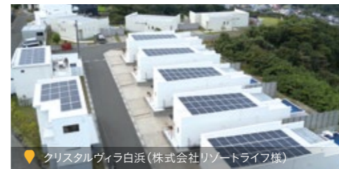
クリスタルヴィラ白浜(株式会社リゾートライフ様)

電気料金の削減が期待できるほか、余剰電力を売電することで収入を得ることも可能です。エネルギーコストの安定化と経済的なメリットの享受は長期的なコスト削減に寄与します。また、企業のCSR活動の一環として、地域社会に対して持続可能な未来への取り組みを示すことができ、企業の社会的評価の向上も期待できます。