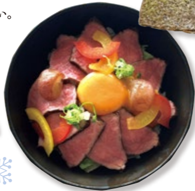
P富士河口湖 熊本県産和王ローストビーフ丼 2,800円(税・サ込)