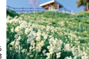
淡路島南端に広がる 灘黒岩水仙郷

スイセンの原産地は地中海沿岸、特にスペイン、ポルトガル。紀元前800年にはホメロスの詩に登場します。学名Narcissusは、ギリシャ神話に登場するナルキッソスに由来するのだとか。日本水仙は早咲きで、1月頃から開花。淡路島、越前海岸が有名です。