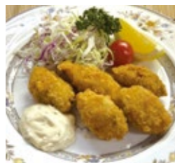
京都 カキフライ 1,650円(税・サ込)