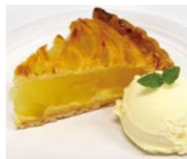
京都 温かいアップルパイ 和三盆ミルクゼラート 980円(税・サ込)