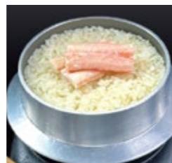
京都 蟹釜飯 980円(税・サ込)