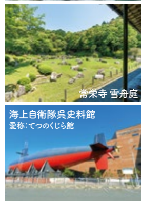
海上自衛隊呉史料館 愛称:つつのくじら館