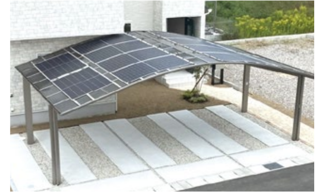
岐阜県岐阜市 T様邸