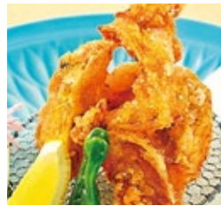
淡路島 3年とらふぐ 唐揚げ 2,750円(税・サ込)