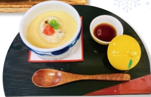
三方五湖 若狭ふぐの白子茶碗蒸し 1,280円(税・サ込) ※数量限定(2025年1月5日より・特別期間を除きます)