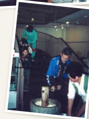
平成4年1月3日 JC琵琶湖で餅つき