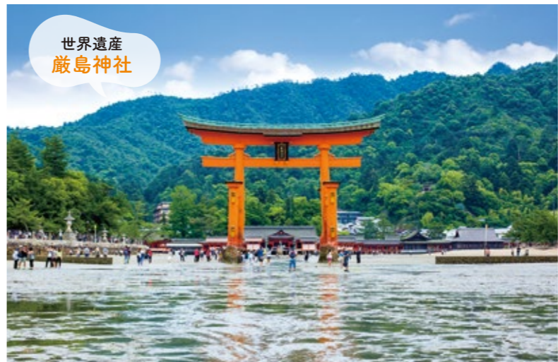
世界遺産 厳島神社