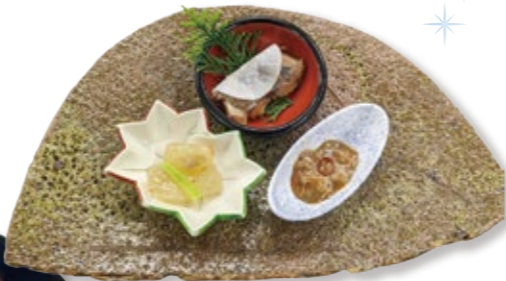
天の橋立 珍味三種盛り 770円(税・サ込) (鯖のへしこ・アンコウ塩辛・マグロ酒盗)

旬の味覚、土地の味わいを楽しんでいただく一品料理をご用意しております。ホテルによって異なりますので、ご予約時にお申し付けください。