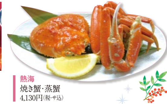
熱海 焼き蟹・蒸蟹 4,130円(税・サ込)