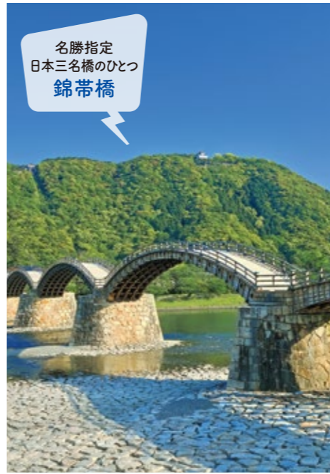
名勝指定 日本三名橋のひとつ 錦帯橋