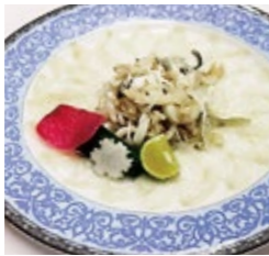
淡路島 3年とらふぐ てっさ 4,950円(税・サ込)