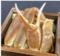
白浜 蟹蒸籠蒸し 3,630円(税・サ込)